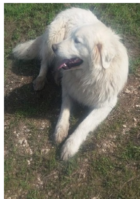
Berger de Maremme et Abruzzes