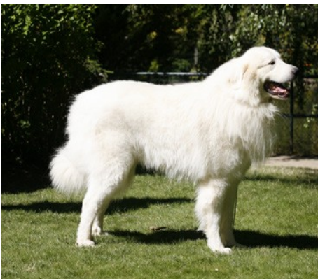
Montagne des Pyrénées

Une filière de production de chiens de protection de qualité (caractéristiques physiques et comportementales) va être structurée progressivement sous l'impulsion du Ministère chargé de l'agriculture, ce qui implique un important travail de recensement et de sélection.